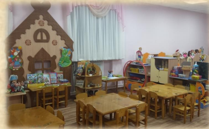
20 февраля 2016 года открытие детского сада после капитального ремонта