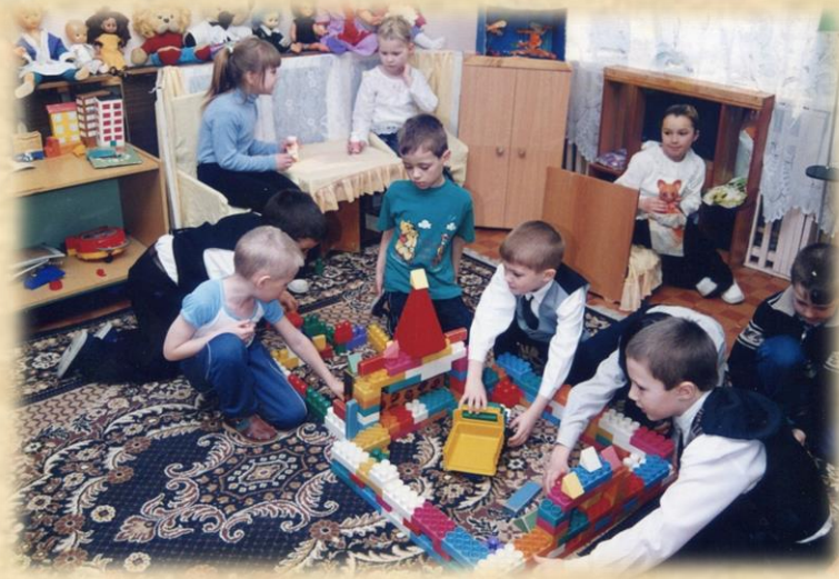
Развивающая среда 2003 год.