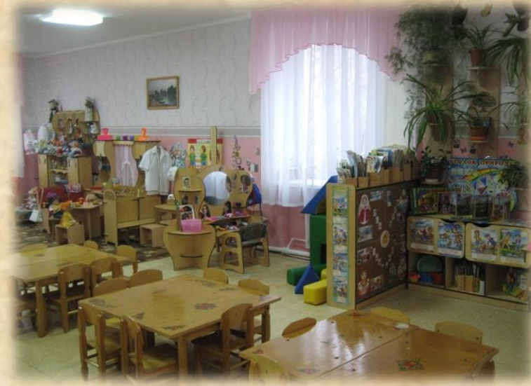
2014 год развивающая предметно-пространственная среда