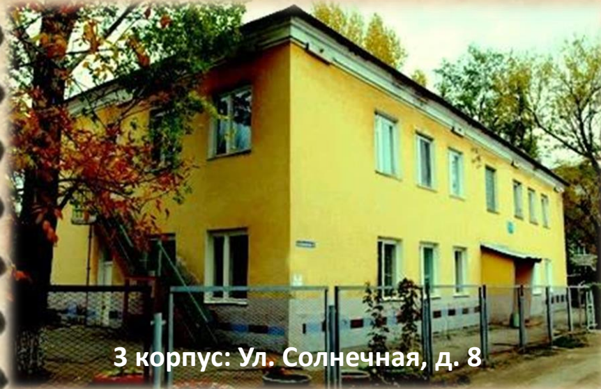
3 корпус: Ул. Солнечная, д. 8