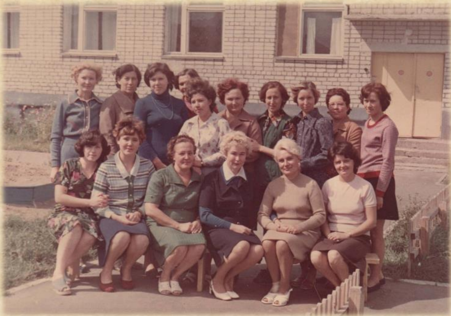
В мае 1978 года новый детский комбинат ясли – сад № 45 завода Стройфарфор начал свою работу.