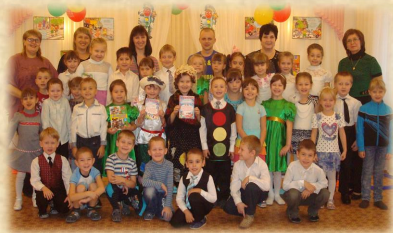
Наши традиции детско-родительские мероприятия