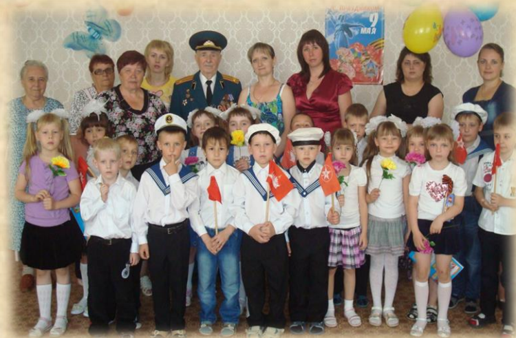
Наши традиции патриотическое воспитание