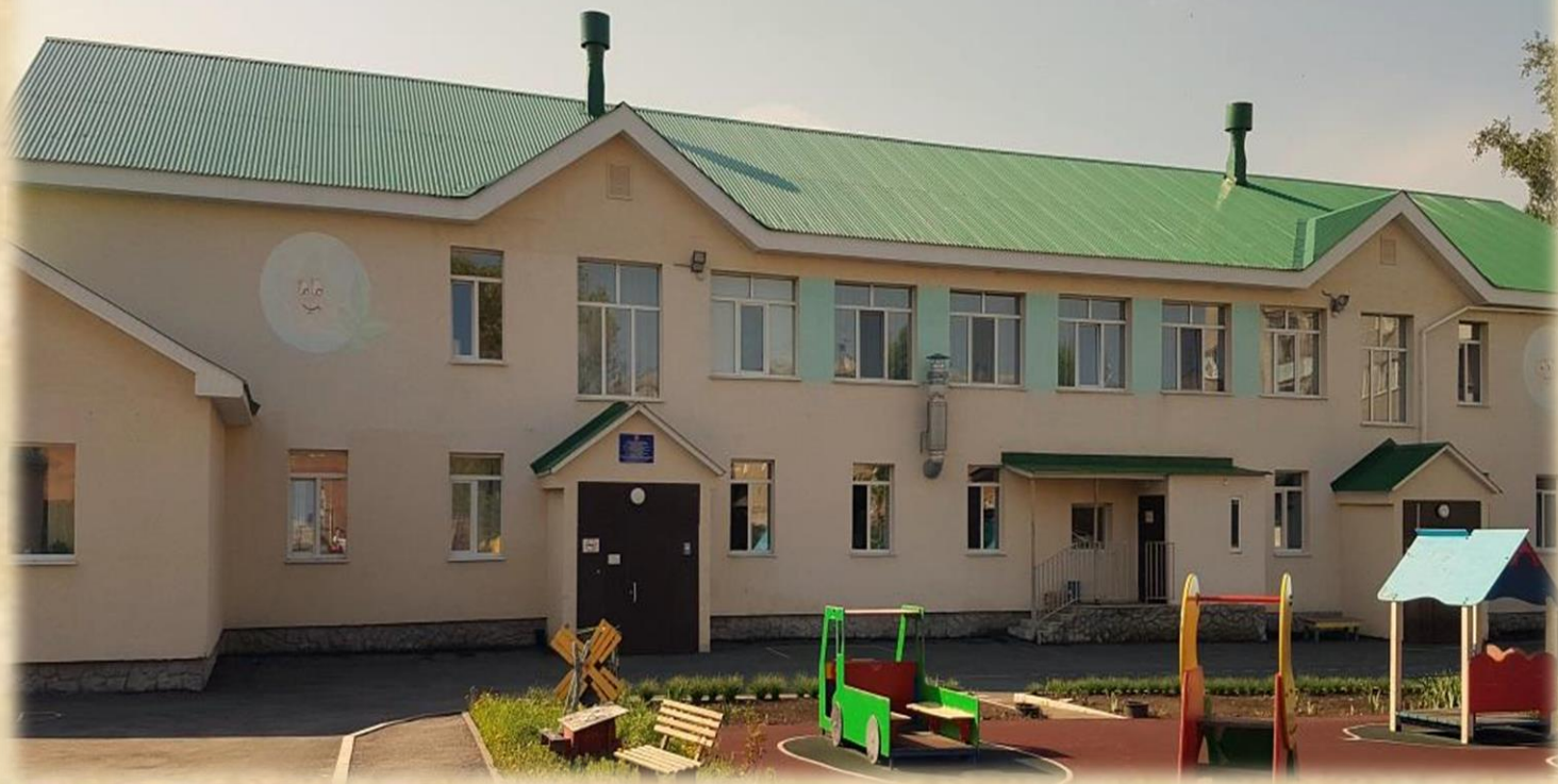
2 корпус (ул. Солнечная, д. 4)

Вас встретят счастливые и умные дети, опытные педагоги, которые учат дошкольников петь и танцевать, улыбаться и общаться, трудиться и играть. Каждое утро детский сад открывает двери и с нетерпением ждет своих воспитанников.