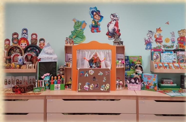
2019 год развивающая предметно-пространственная среда