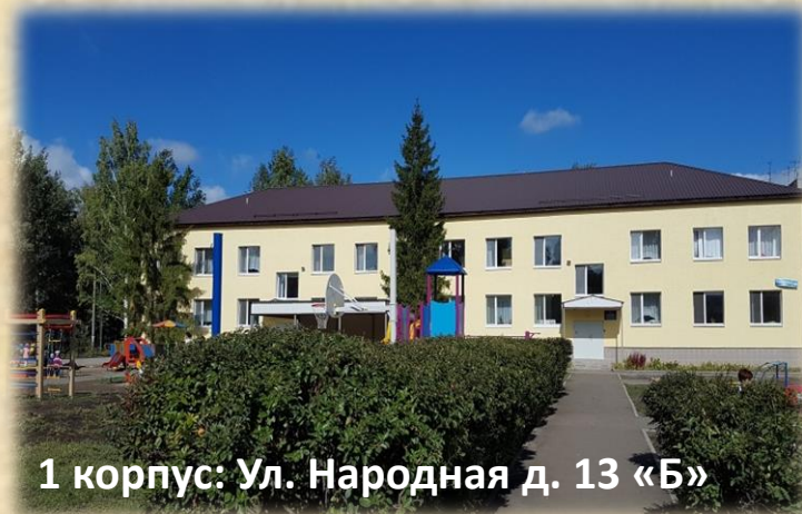
1 корпус: Ул. Народная д. 13 «Б»