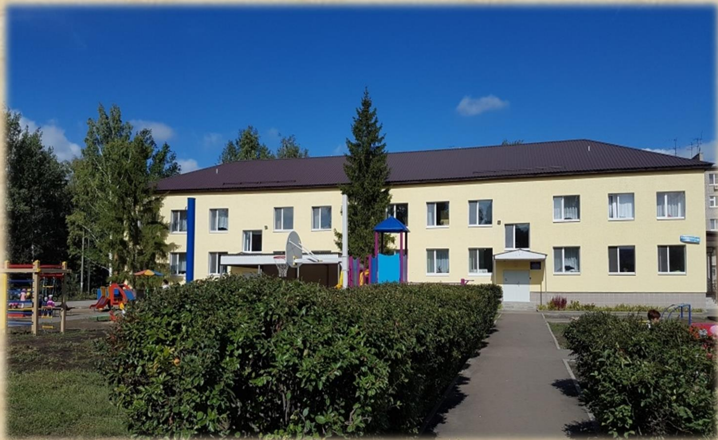
1 корпус (ул. Народная, д. 13 «Б»)

Есть в поселке Стройкерамика м.р. Волжский Самарской области «Детский сад «Солнышко». Если вы зайдете туда, то, наверняка, почувствуете атмосферу тепла и уюта.