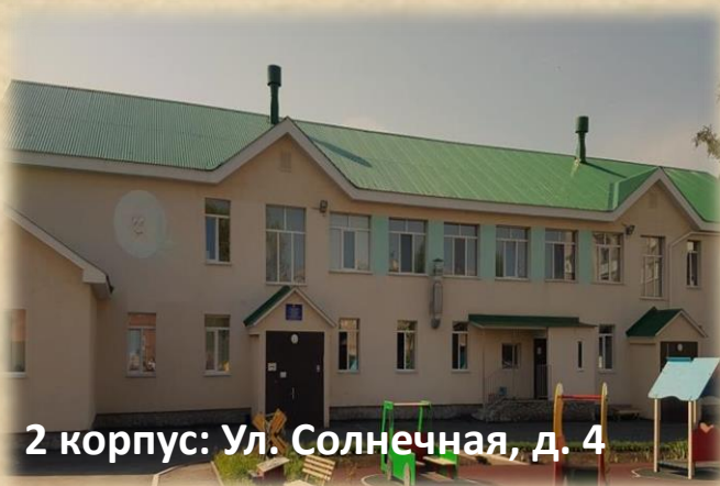
2 корпус: Ул. Солнечная, д. 4