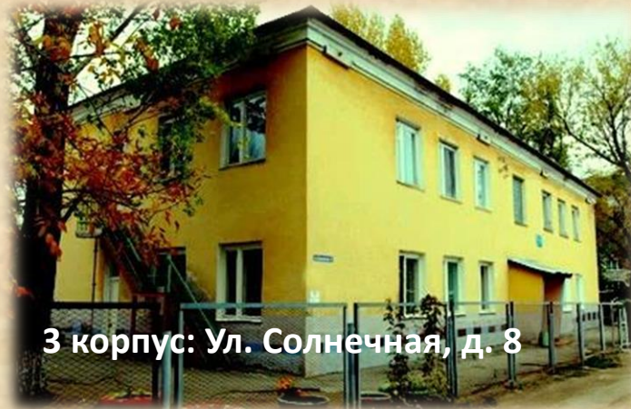
3 корпус: Ул. Солнечная, д. 8